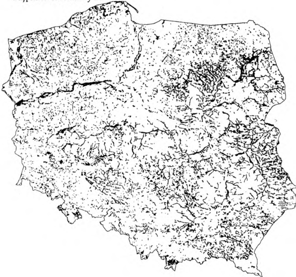
Rys. 1. Mapa łąk opracowana na podstawie zdjęć satelitarnych wykonanych za pomocą skanera TM przez satelitę Landsat

tych użytków określanej przez GUS o około 0.83 mln ha, czyli o 21%. Różnicę tę stanowią najprawdopodobniej łąki, których jednostkowa powierzchnia jest mniejsza od 25 ha i jako takie nie były zaznaczane na mapie, lub które z różnych względów nie zostały rozpoznane na zdjęciach satelitarnych.